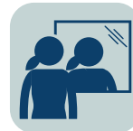
TRASTORNOS DE ALIMENTACIÓN O DE IMAGEN CORPORAL