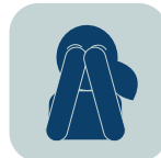
PROBLEMAS DE AUTOESTIMA