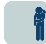
EVITACIÓN O AISLAMIENTO