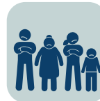
PROBLEMAS FAMILIARES Y PARA RELACIONARSE