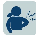
DOLORES Y PROBLEMAS FÍSICOS