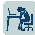
PROBLEMAS LABORALES O CON EL ESTUDIO